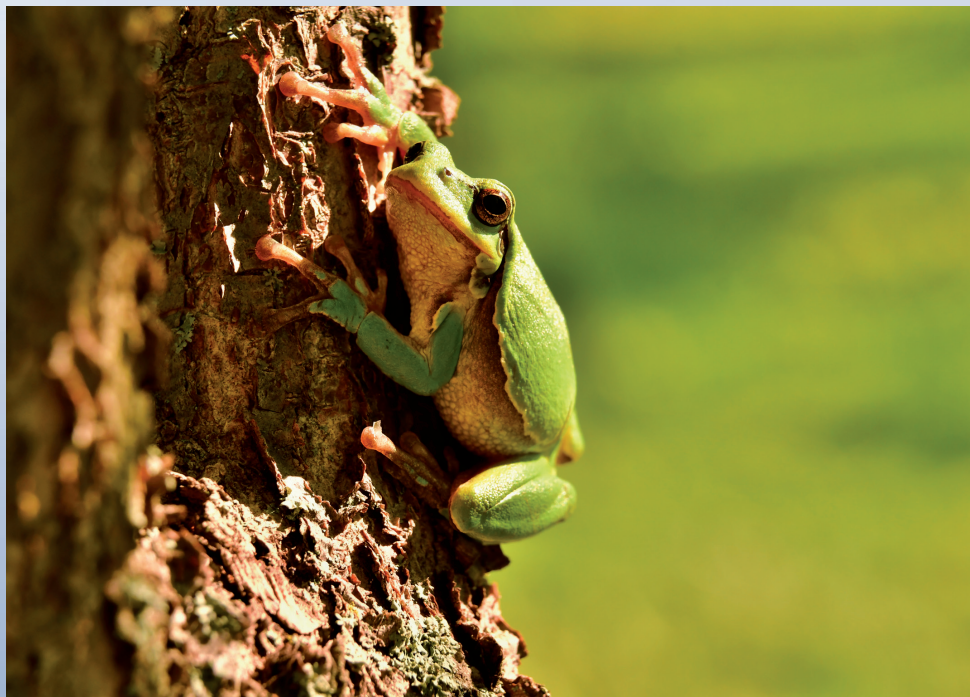
Rosnička zelená V