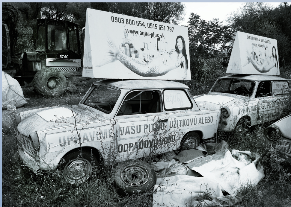
Vladimír Vajs, Umyjeme vašu vodu